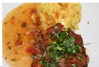
Impressionen der Frühlingsküche