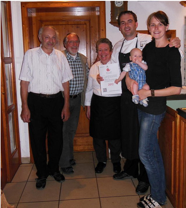
Goldener Stern in Rohrbach

Unsere Genussführer-Gasthäuser erhielten zum Aufkleber, der bereits an der Eingangstüre darauf hinweist, dass dieses Lokal von uns besonders empfohlen wird, jetzt noch eine Urkunde.