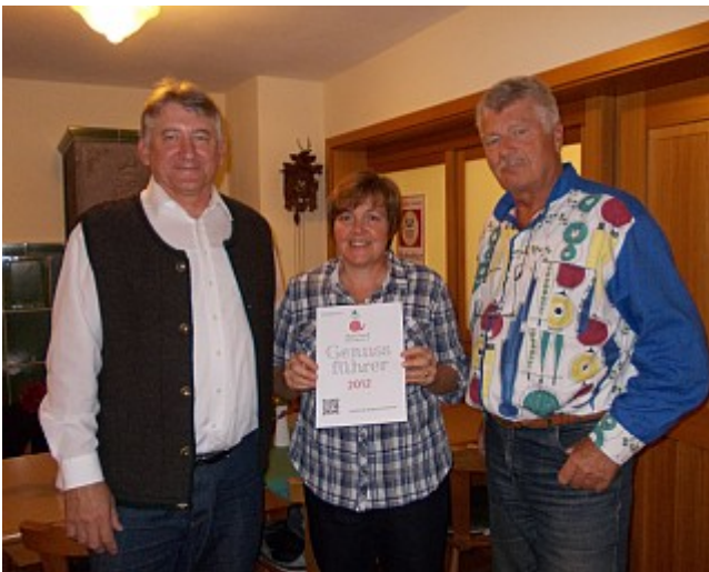
Zum Adler in Wollishausen