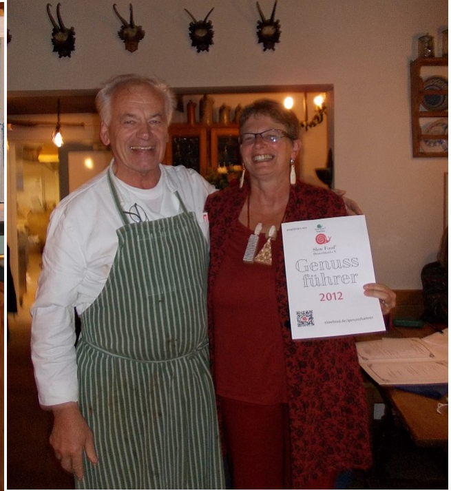
Gasthof Hartl in Klingen