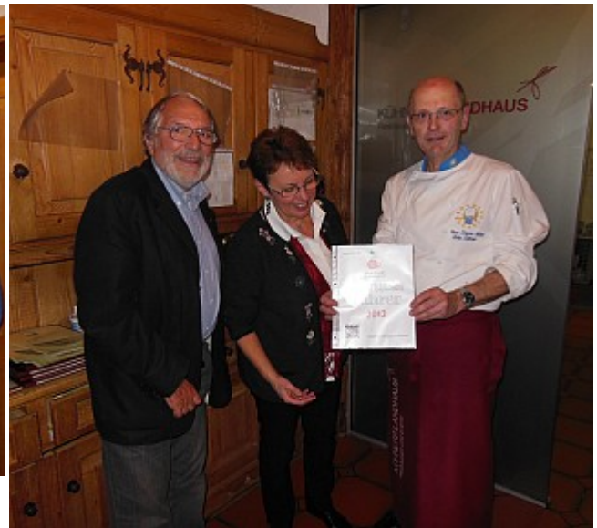
Kühners Landhaus in Kissing