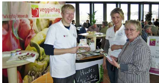
Aktionstag in der Kantine der Agentur für Arbeit

„Immer mehr Gäste interessieren sich für attraktive vegetarische Alternativen. Unsere Teilnehmer können diesem Trend Rechnung tragen und ihr Angebot weiterentwickeln. Wichtig ist dabei, dass den Gästen schon beim Lesen der Speisekarte das Wasser im Mund zusammenläuft. Nebenbei unterstützt der Gast mit seinem vegetarischen Gericht auch den Klimaschutz.“