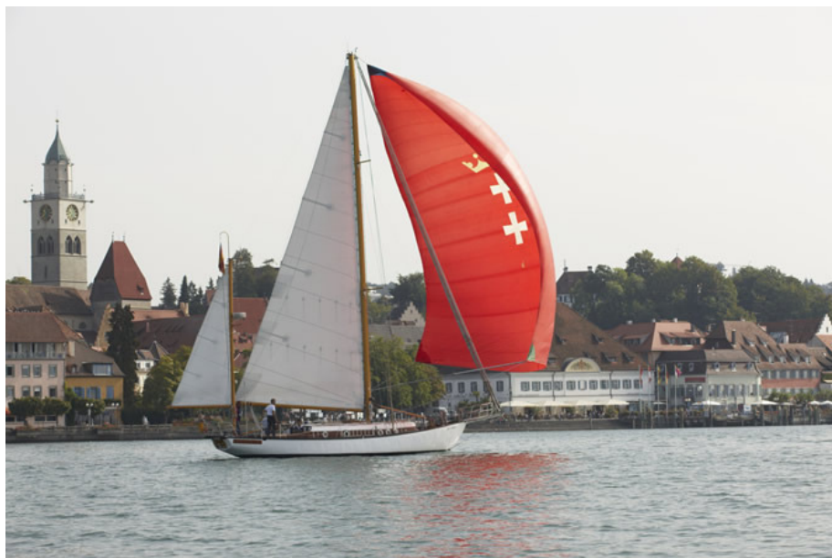
Die „Wappen von Danzig“ vor Überlingen“