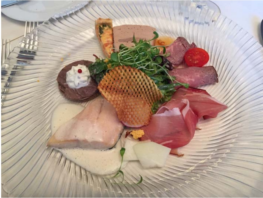
Der Vorspeisenteller: Anti Pasti auf Badisch z. B. Selbstgeräucherter Schinken, Wildschweinpastete, gedünstete Forelle mit Meerrettichschaum, Tafelspitztaler, Gemüsequiche,..