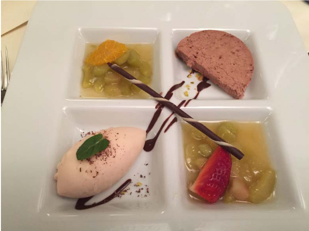
Das Dessert: Trilogie von Rhabarber und Schokolade