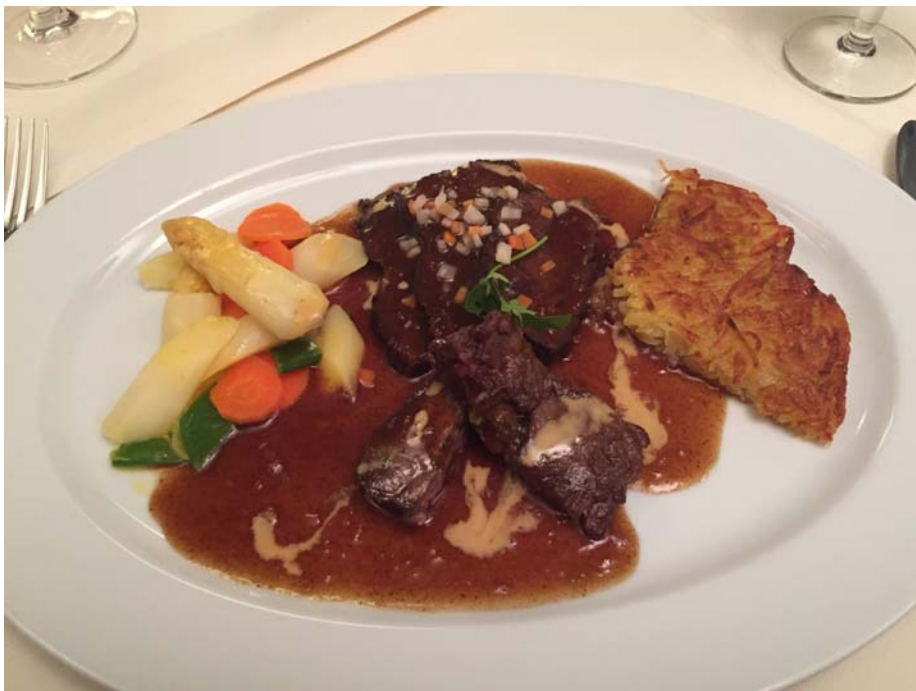
Der Hauptgang: Duett vom Wiesentäler Kalb und Rind