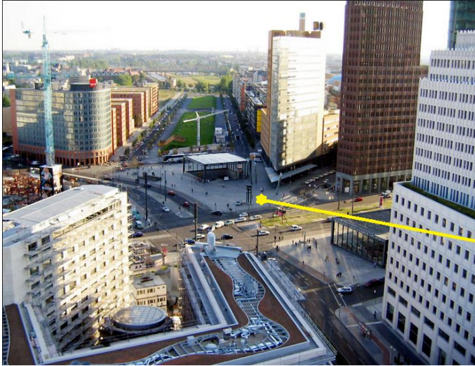
Treffpunkt Slow Food bei der Wir haben es satt! Demo 2015

SLOW-FOOD-TREFFPUNKT in diesem Jahr ist die alte Uhr/Ampelanlage auf dem Potsdamer Platz, ab ca. 11 Uhr. Das ist ziemlich weit vorne an der Bühne, aber wir wollen ja, dass man den Einsatz unserer Schnecke auch gut sieht!